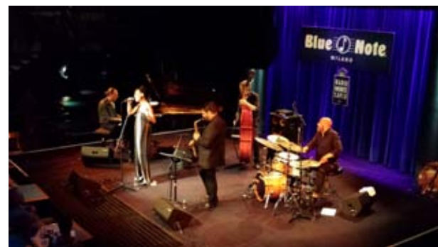
“Parole Parole” live - Blue Note Milano https://www.youtube.com/watch?v=k0ttqIpyAHM