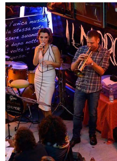
Con Fabrizio Bosso