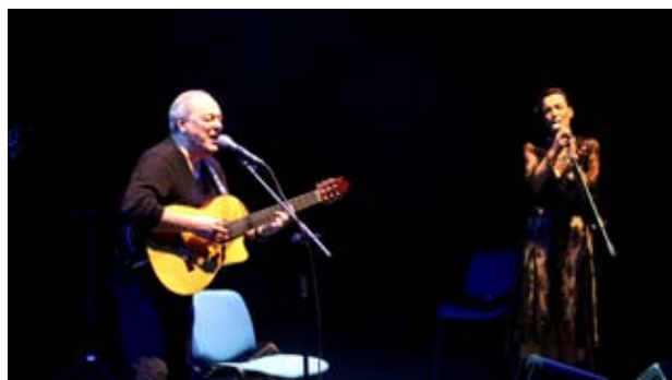
“Io so che ti amerò” Greta e Toquinho live https://www.youtube.com/watch?v=p64YZ06jzvg