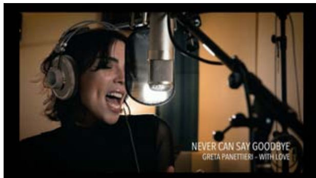
“Never can say goodbye” dall’album “With Love” https://www.youtube.com/watch?v=SCbbNasBUFI