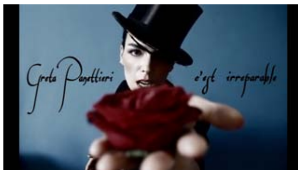
“C’est irreparable” / Un anno d’amore https://www.youtube.com/watch?v=3efdY2kw8I0