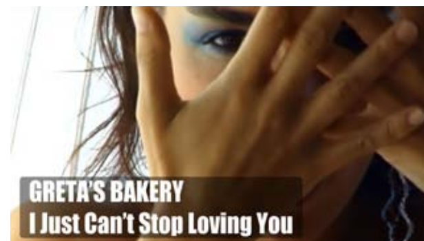
“I just can’t stop loving you” / “Under Control” https://www.youtube.com/watch?v=lqUx0VJHDgA