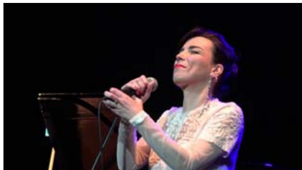
“Shattered” live - Auditorium PDM https://www.youtube.com/watch?v=hCm9wmmyp-g