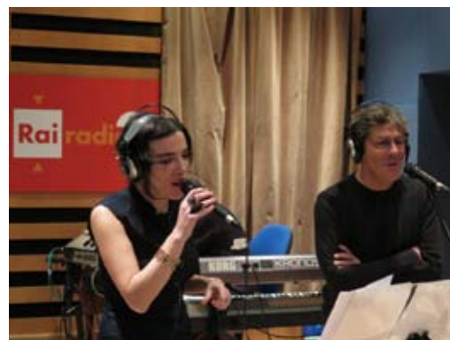
Con Luca Barbarossa a Radio 2 Social Club